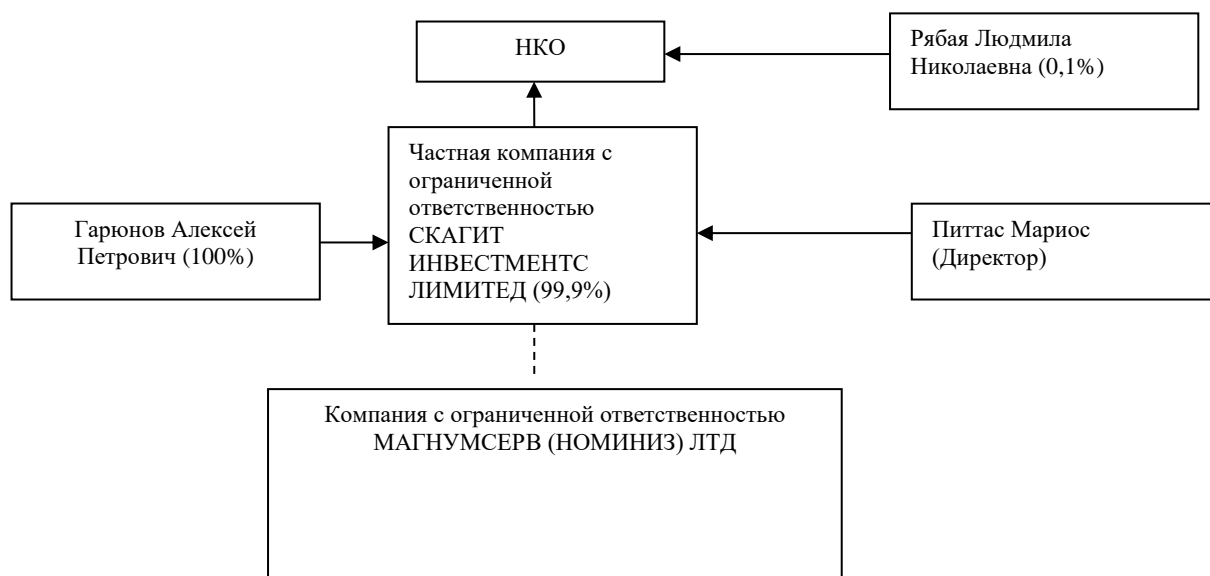
Рисунок 1 – Характер взаимосвязей между учредителями (участниками).

В соответствии со ст. 4 Федерального закона «О банках и банковской деятельности» участники НКО составляют группу лиц, имеющую возможность оказывать прямое влияние на решения, принимаемые органами управления НКО. Характер взаимосвязей между учредителями (участниками) НКО представлен схематично на рисунке 1.