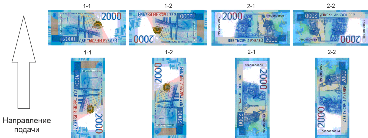
Рис.1. Ориентация банкноты при различном направлении подачи

2.2.4. Полученные результаты занести в таблицу 2 протокола проверки.