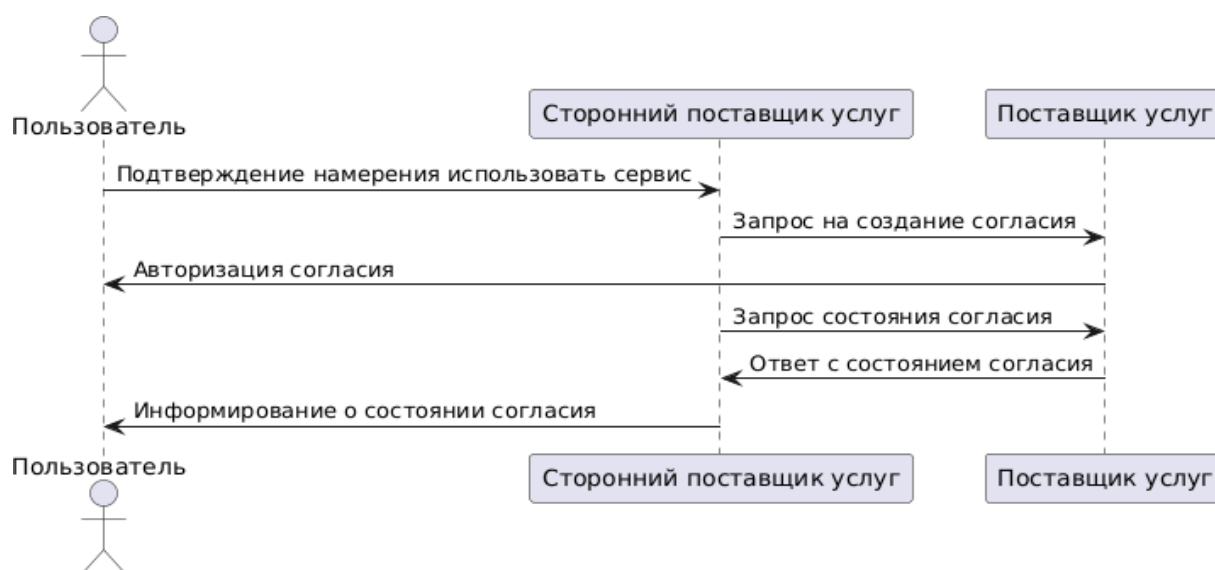
Рисунок 2. Схема выдачи согласия