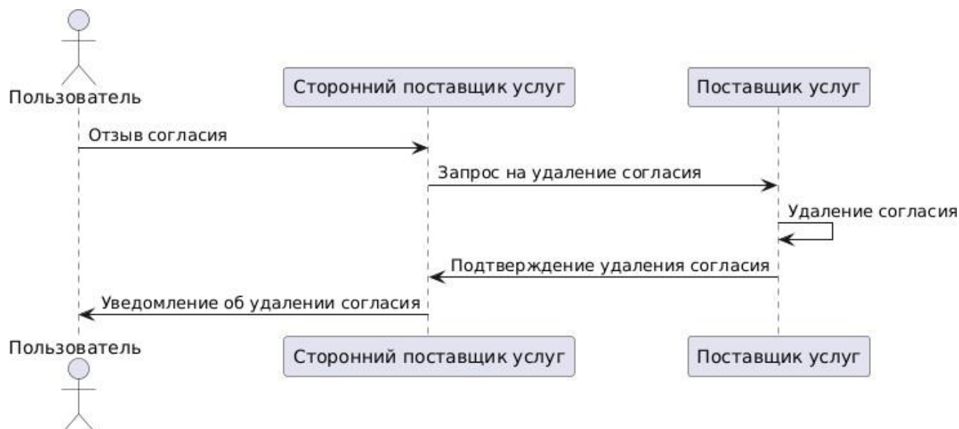
Рисунок 3. Схема отзыва согласия.

При отзыве согласия, направляемого Пользователем, Сторонний поставщик услуг (СПУ) разъясняет Пользователю последствия отзыва согласия, сообщив о возможных ограничениях в части предоставления конкретной услуги Пользователю.