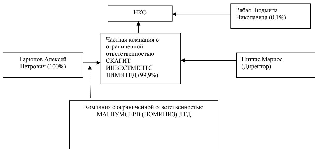
Рисунок 1 – Характер взаимосвязей между учредителями (участниками).

В соответствии со ст. 4 Федерального закона «О банках и банковской деятельности» участники НКО составляют группу лиц, имеющую возможность оказывать прямое влияние на решения, принимаемые органами управления НКО. Характер взаимосвязей между учредителями (участниками) НКО представлен схематично на рисунке 1.