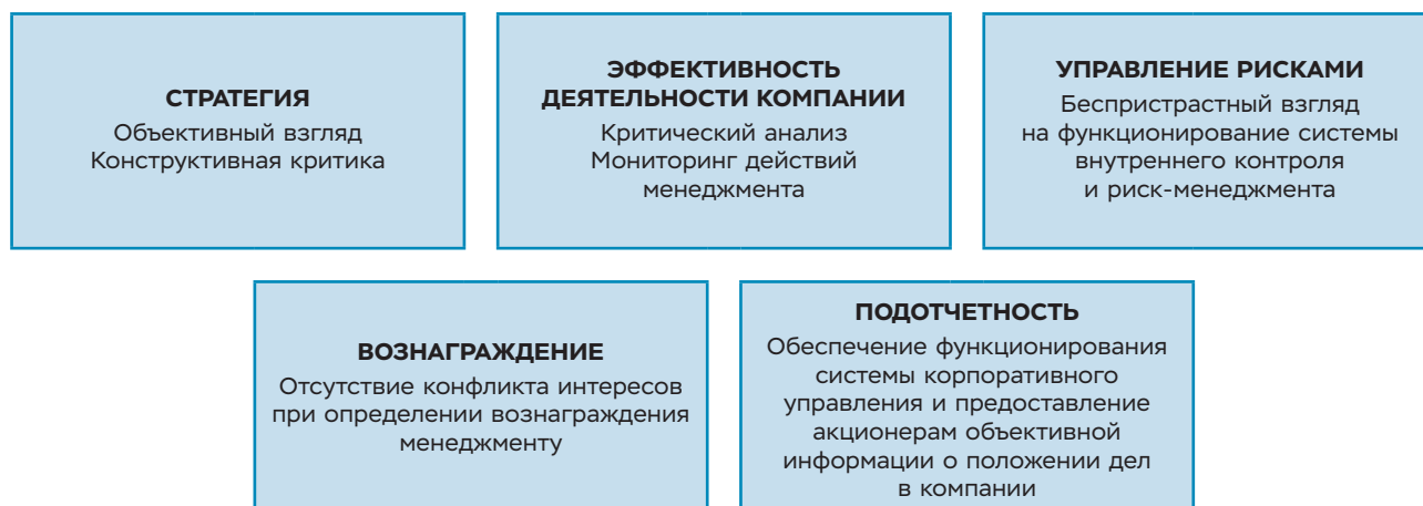
РИСУНОК 2. РОЛЬ НЕЗАВИСИМЫХ ДИРЕКТОРОВ