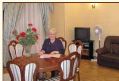
Комната для преподавателей