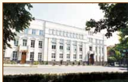
Центральный банк Республики Армения Административное здание