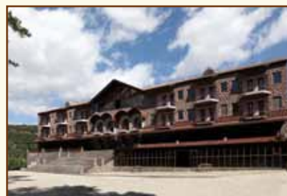
Учебный центр Центрального банка Республики Армения (г. Цахкадзор)

Учебный центр Центрального банка Республики Армения г. Цахкадзор (код страны и города 374 10) тел./факс: 28-29-52