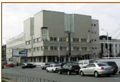
Межрегиональный учебный центр Банка России (г. Тула)