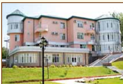
Учебно-оздоровительный центр Национального банка Таджикистана (г.Кайраккум)