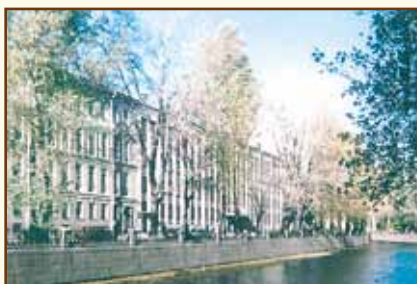
Санкт-Петербургская банковская школа (колледж) Банка России