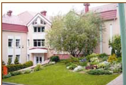
Учебный центр Национального банка Республики Беларусь (д. Раубичи)