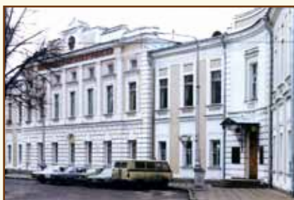
Учебно-методический центр Банка России

Учебно-методический центр Банка России является структурным подразделением Банка России. Разрабатывает учебно-методическую документацию (учебные планы, программы) по специальности «Банковское дело» и по программам дополнительного профессионального образования персонала Банка России, реализуемым в образовательных учреждениях и учебных центрах Банка России, а также учебно-методические материалы (учебно-методические пособия, наглядные и другие материалы) для методического обеспечения учебного процесса.