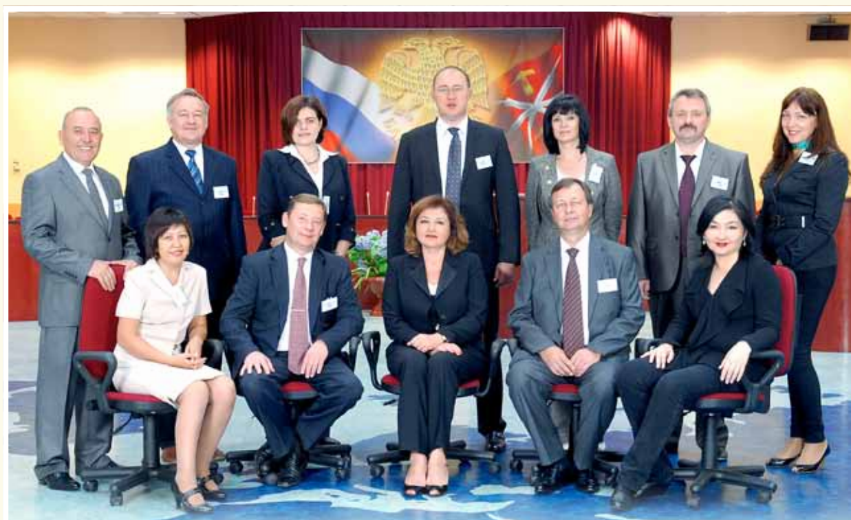
Участники 14-го заседания Координационного совета по вопросам профессионального обучения персонала центральных (национальных) банков государств-участников ЕврАзЭС 30 августа – 1 сентября 2011 года

Целью организации обучения является систематическое повышение квалификации руководящих работников и специалистов центральных (национальных) банков государств-участников ЕврАзЭС по актуальным направлениям банковской деятельности, а также рационализация усилий центральных (национальных) банков государств-участников ЕврАзЭС в этой области.