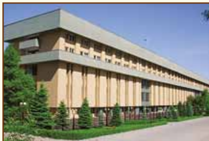
Национальный банк Республики Казахстан Административное здание

050040, Республика Казахстан, г. Алматы, мкр-н «Коктем-3», 21 Факс: (7 727) 261-73-52, 270-47-03, 270-47-99, 270-46-15