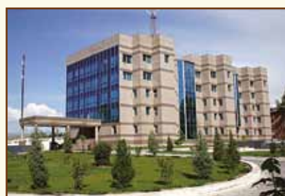
Национальный банк Таджикистана Административное здание