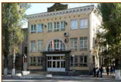
Национальный банк Кыргызской Республики Административное здание

720040, Кыргызская Республика, г. Бишкек, ул. Т. Уметалиева, 101 Факс: (996 312) 61-07-30, 61-52-86, 66-92-04