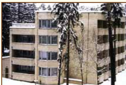
Центр подготовки персонала Банка России

Центр подготовки персонала Банка России является головным учебным заведением в системе повышения квалификации персонала Банка России. Здесь проводятся учебные мероприятия для руководящих работников и специалистов центрального аппарата, территориальных учреждений и организаций Банка России.