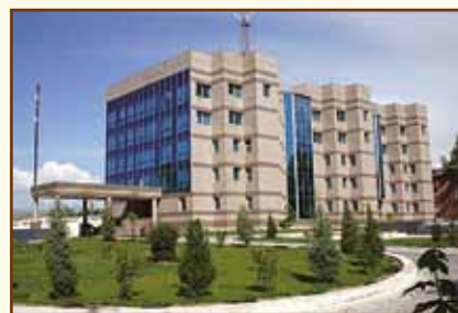
Национальный банк Таджикистана Административное здание