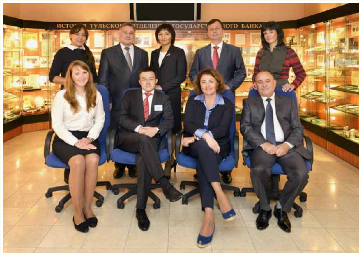
Участники 16-го заседания Координационного совета по вопросам профессионального обучения персонала центральных (национальных) банков государств-участников ЕврАзЭС 28-30 августа 2012 года

Целью организации обучения является систематическое повышение квалификации руководящих работников и специалистов центральных (национальных) банков государств-участников ЕврАзЭС по актуальным направлениям банковской деятельности, а также рационализация усилий центральных (национальных) банков государств-участников ЕврАзЭС в этой области.