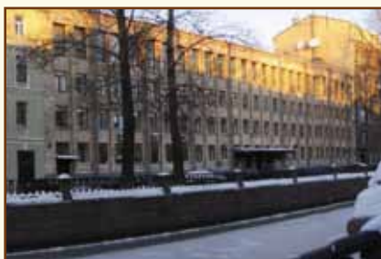
Санкт-Петербургская банковская школа (колледж) Банка России