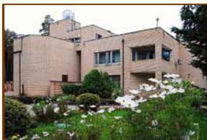
Центр подготовки персонала Банка России