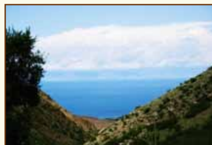
Вид озера Иссык-Куль в окрестностях с. Бостери