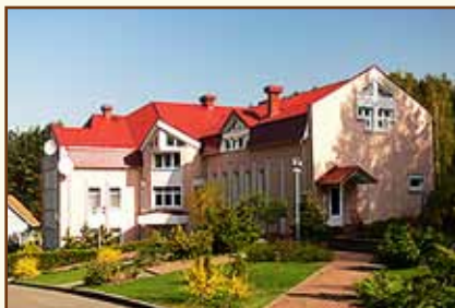
Учебный центр Национального банка Республики Беларусь (д. Раубичи)