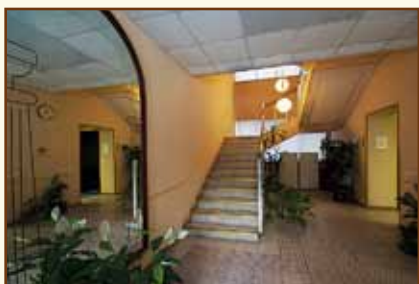
Холл учебно-гостиничного корпуса

Центр подготовки персонала Банка России является головным учебным заведением в системе повышения квалификации персонала Банка России. Здесь проводятся учебные мероприятия для руководящих работников и специалистов центрального аппарата и территориальных учреждений Банка России.