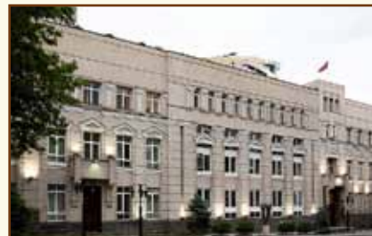
Центральный банк Республики Армения Административное здание