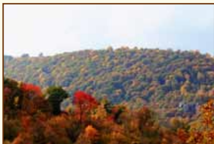
В окрестностях г. Цахкадзор

Учебный центр является структурным подразделением Центрального банка Республики Армения.